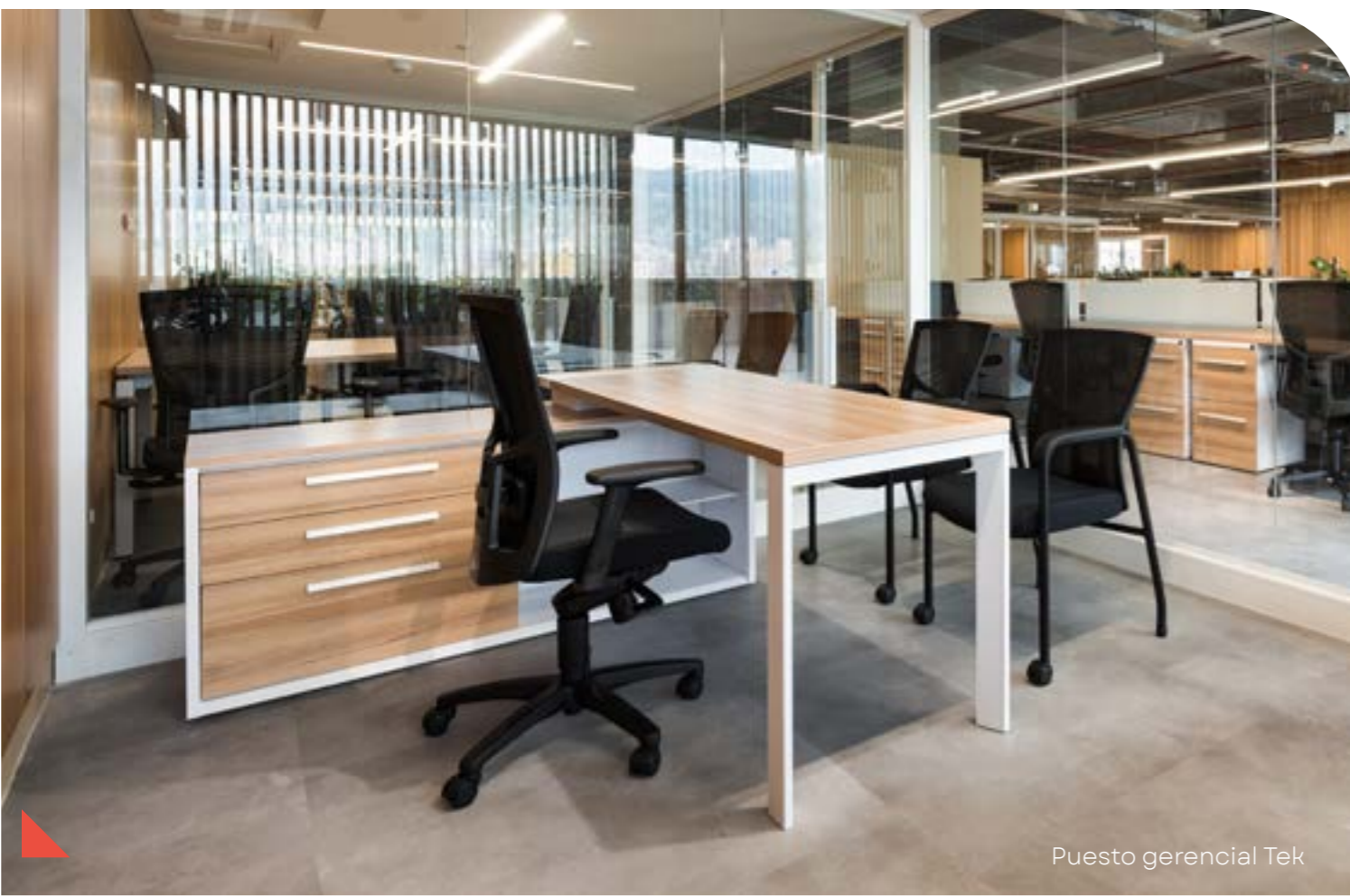
Puesto gerencial Tek

El sistema Tek permite modular logrando configuraciones en tren de trabajo (bench), ejecutivas, gerenciales y giros de 120 grados; lo que permite adaptabilidad y aprovechamiento de los espacios.