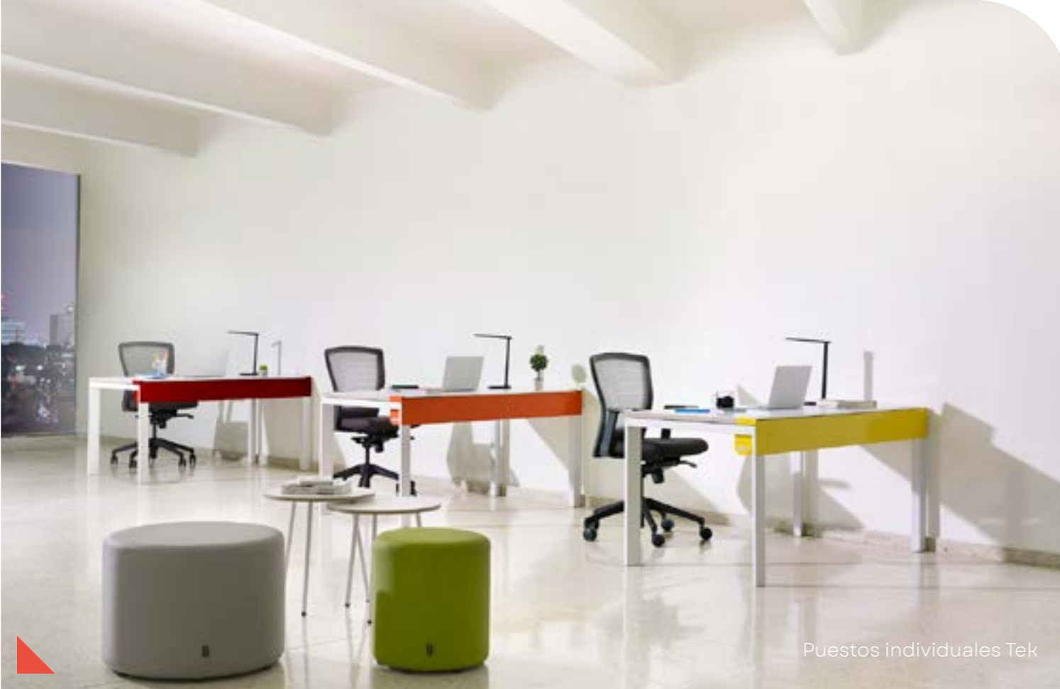
Puestos individuales Tek

Tek permite personalizar los colores acorde a las necesidades de los clientes; ofreciendo 11 gamas que van desde los colores más neutros a los que tienen más carácter.