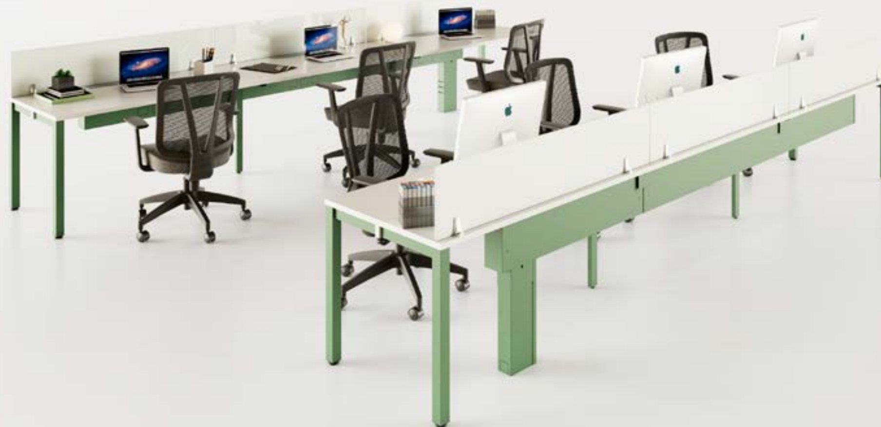
Puestos operativos sencillos Koncisa 2.0

Es la solución ideal de mobiliario para aquellos que buscan un sistema versátil, sencillo y que se ajusta a diferentes espacios y presupuestos.