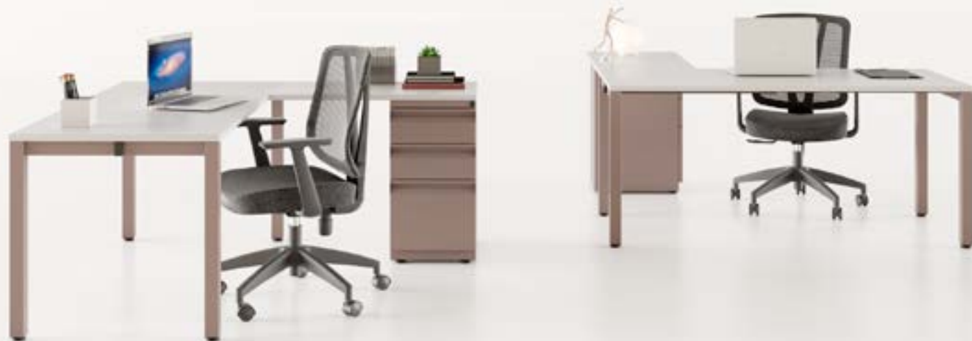
Puestos individuales Koncisa 2.0

Koncisa 2.0 permite personalizar los puestos de trabajo con tonos sobrios o llamativos que se adaptan a los nuevos diseños de espacios, contribuyendo a crear ambientes de trabajo más agradables y productivos.