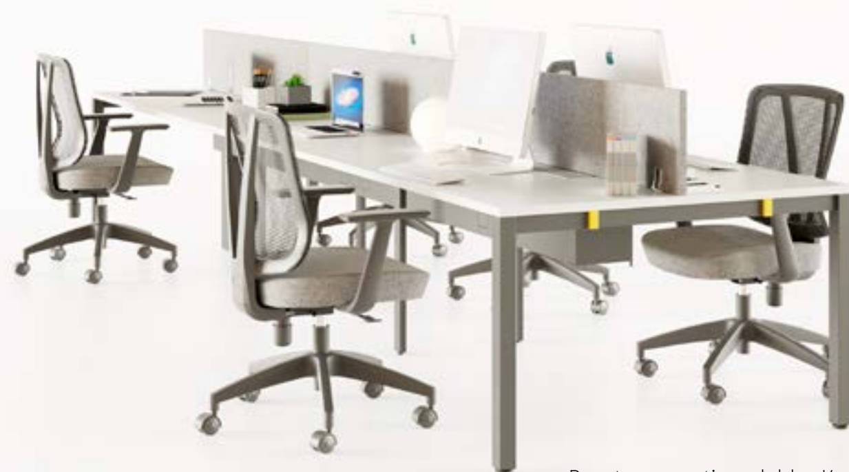
Puestos operativos dobles Koncisa 2.0