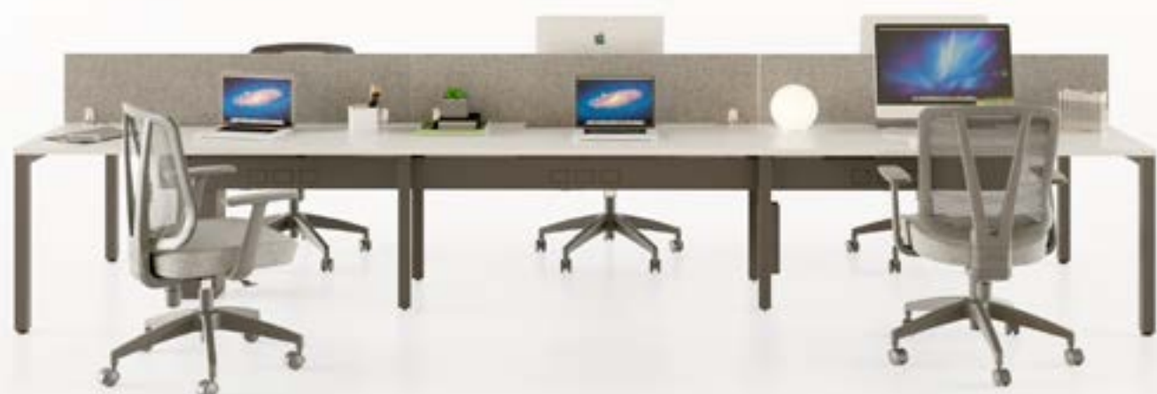
Puestos operativos dobles Koncisa 2.0

Simplifica y agiliza el proceso de instalación al minimizar la necesidad de ajustes y preparaciones adicionales.