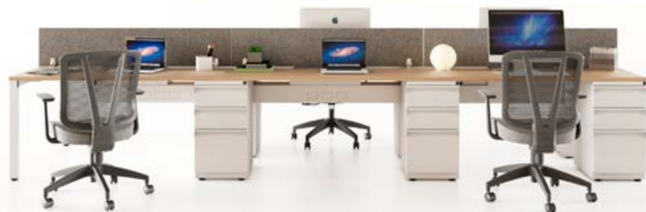
Puestos operativos dobles Koncisa 2.0

Koncisa 2.0 tiene un diseño más sencillo que satisface las necesidades de cada empresa y puede ser utilizado en diferentes espacios, lo que lo convierte en una opción versátil y económica para cualquier empresa.