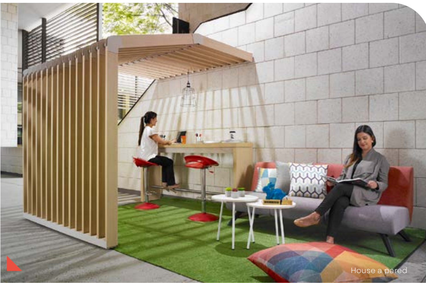
House a pared

House permite generar diferentes ambientes y usos en su interior y exterior, gracias a las distintas configuraciones que se pueden lograr con su diseño.